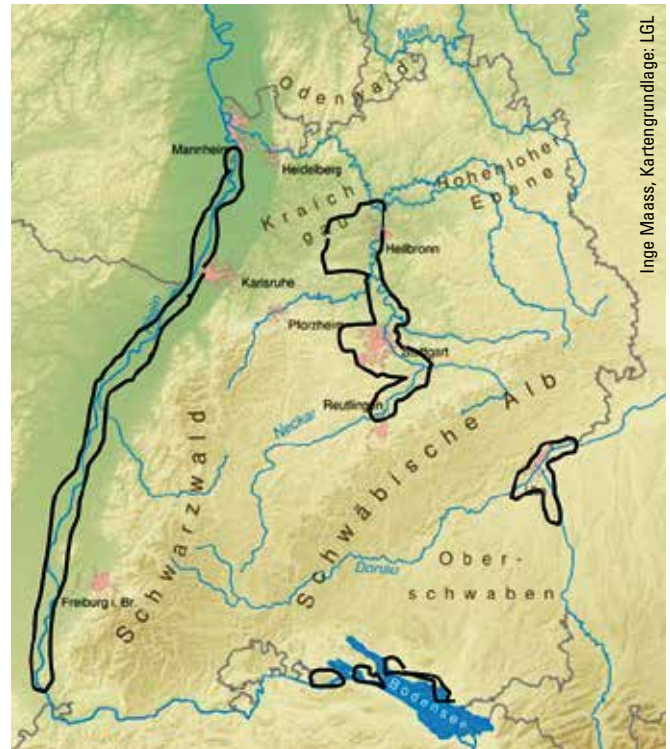
Aus der Karte geht die natürliche Verbreitung der Schwarz-Pappelvorkommen in Baden-Württemberg hervor. Restvorkommen finden sich entlang des Oberrheins, am Neckar, an der Donau und am Bodensee.

Das ASP hat in seinem genetischen Labor 686 Proben von Schwarz-Pappeln aus folgenden Herkünften untersucht: Neckar inklusive Sämlinge aus Freiberg a. N., Nördlicher Oberrhein bei Karlsruhe, Südlicher Oberrhein, Bodensee in Baden-Württemberg bei Langenargen und Kressbronn, Grenzgebiet der Donau zwischen Bayern und Baden-Württemberg und die bayerische Donau bei Günzburg.