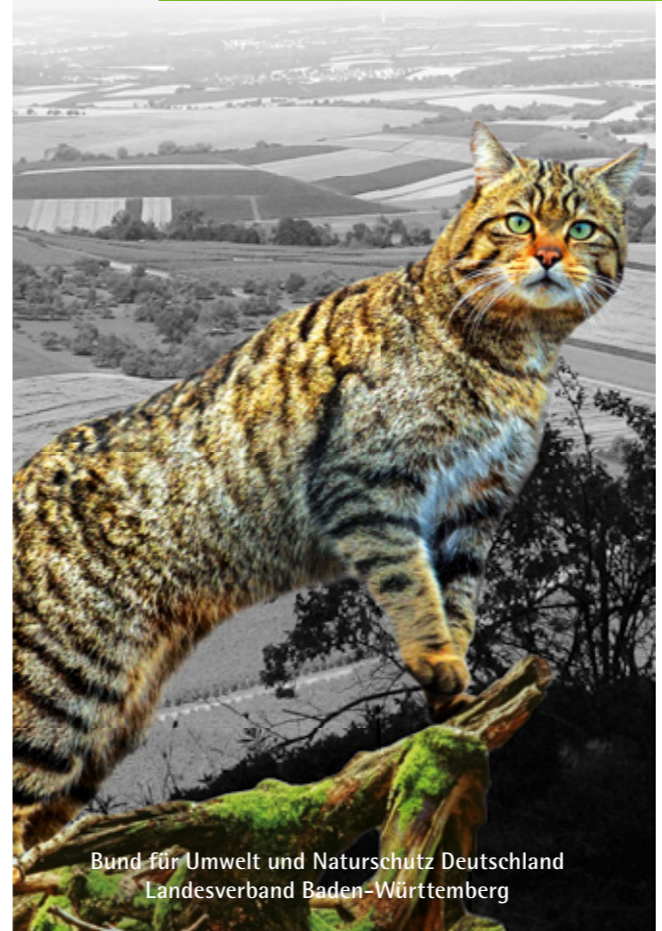
Bund für Umwelt und Naturschutz Deutschland Landesverband Baden-Württemberg

Gemeinsam können wir die Rote Liste-Art retten.